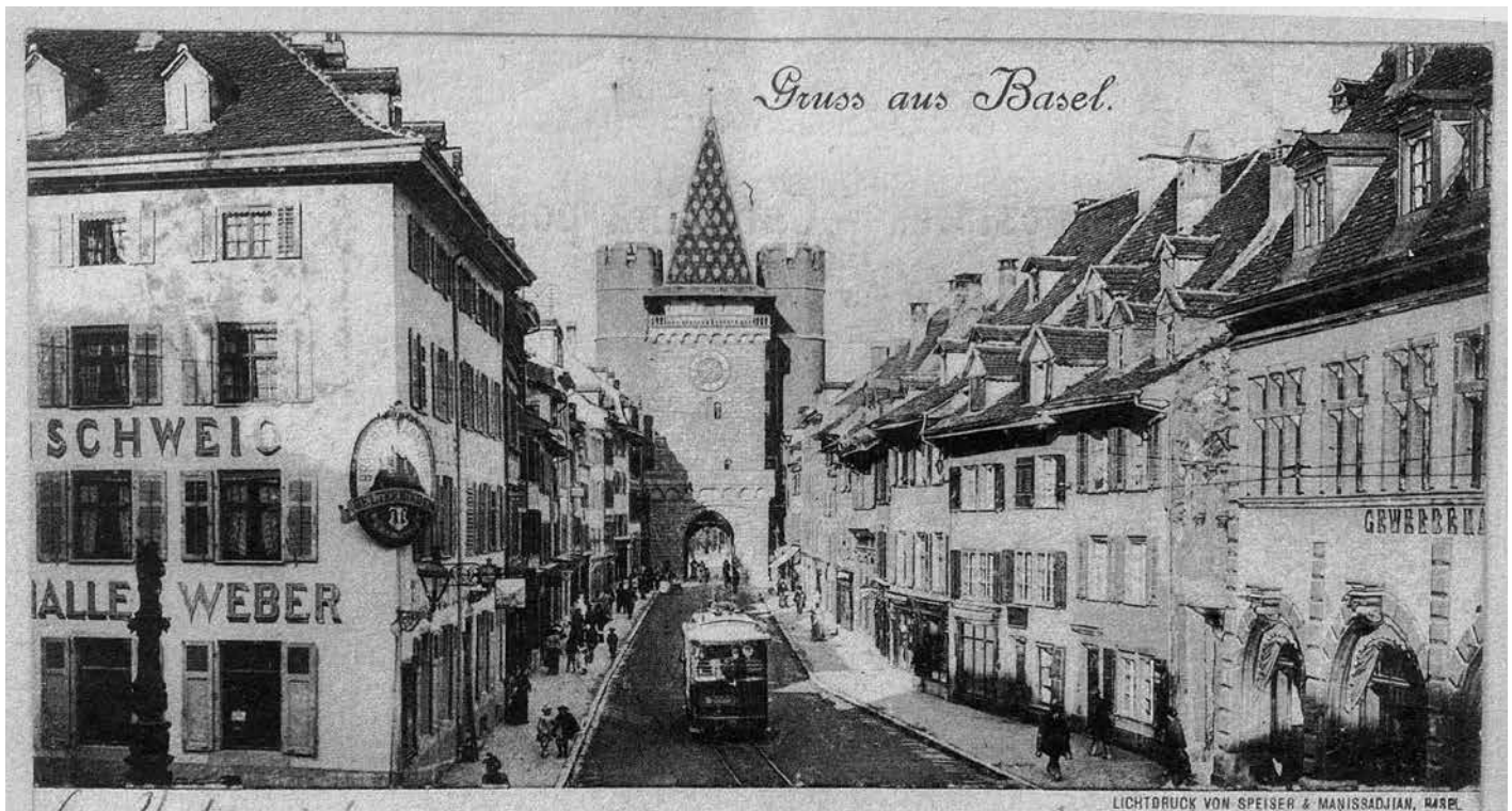
Ansichtskarte der Spalenvorstadt (Poststempel: 13 Juli 1902). Links die Einmündung der Schützenmattstrasse beim Spalenbrunnen an der Ecke des Hotels «Braunschweig» und der «Bierhalle Weber»

Wann der Gasthof «zum Ochsen» eröffnet worden ist, darüber haben sich offenbar keine Informationen erhalten. Die früheste Nachricht stammt aus dem Jahr 1732. Damals wurde der «Schwarze Ochsen einem Ehrlichen braven Wirth zum Ausleyen» angeboten. Es gab danach zahlreiche Pächterwechsel. Ab 1885 wirtete ein J. Starkemann im Ochsen. Am 29. September liess er ein Inserat im «Schweizerischen Volksfreund» erscheinen, dessen Illustrations-Zeichnung eine Nähe zum 'schwarzen Humor' besitzt, insbesondere, was den Text auf der Vorderseite des Gegenstandes betrifft, den das als Metzger bekleidete Ferkel vor sich herträgt: «Heute Schlachtfest», und dann seine Position über dem Text mit der Aufzählung des Angebots «gebratene Span-Ferkel»!