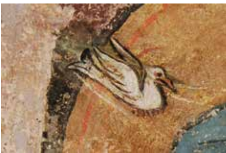
„Das Geistvögelein berührt Maria bei der Verkündigung.“ (Keppenbachkapelle)

Diesen wunderbaren gefiederten Wesen widmen wir den Tag der offenen Peterskirche am 22. Juni. An diesem Tag kann man die Kirche von ihren frühmittelalterlichen Fundamenten bis zu den Glocken auf dem Turm erleben. Thematische Führungen verbinden die Darstellungen von Vögeln im Kirchenraum mit biblischen Geschichten. Die Ornithologische Gesellschaft ist mit einem Stand präsent und erteilt fachkundige Informationen rund um die Vögel in der Stadt Basel.