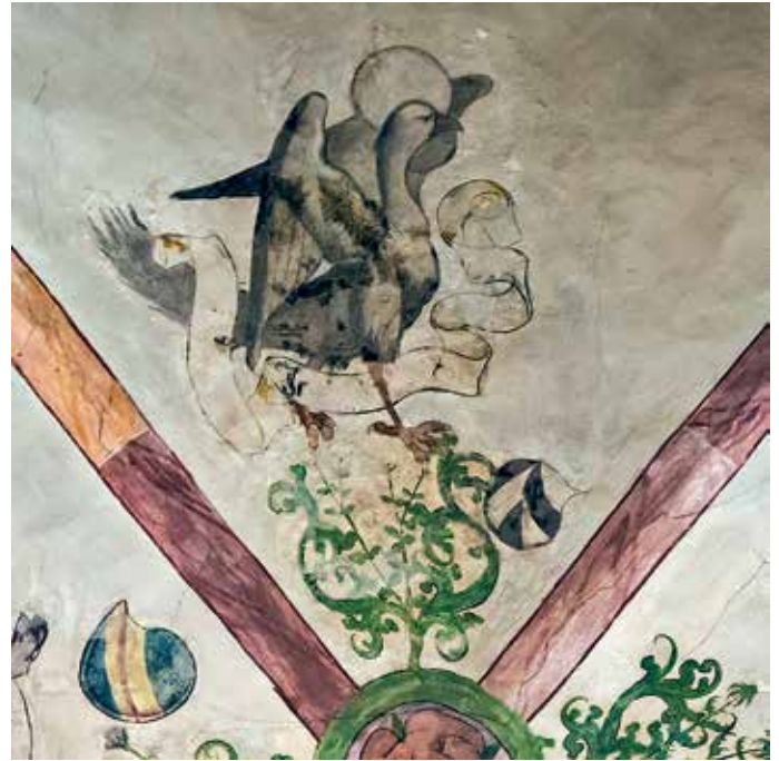
Das Symbol des Evangelisten Johannes in der Sakristei

An einem frühen Frühlingsmorgen zwitschert, trillert und flötet es in den hohen alten Bäumen am Petersplatz. In der Peterskirche ist es zwar noch ganz still, aber auch dort verstecken sich im Gewölbe, auf Wänden, in den Bänken und sogar auf der Kanzel zahlreiche Vögel in Farbe, Holz und Stein. Kein Wunder: In der Bibel werden Vögel an über 270 Stellen erwähnt! Der bekannteste ist wohl Noahs Taube, die nach vielen Tagen Sintflut einen Olivenzweig zur Arche bringt und mit ihm die Hoffnung auf ein neues, friedliches Leben. Oder der Hahn, der mit seinem Ruf die Menschen weckt und sie ermahnt, ihr Leben nicht zu verschlafen. In vielen Geschichten, Vergleichen und Metaphern spielen Vögel eine wichtige Rolle, zum Beispiel als Symbol für Freiheit, wie in dieser Baseldeutschen Übersetzung des 124. Psalms: Unser Lääben isch wien e Vöögeli, won em Voogelfänger abghauen isch. D' Voogelfallen isch kabooris gangen Und miir – mir sin abghaue.