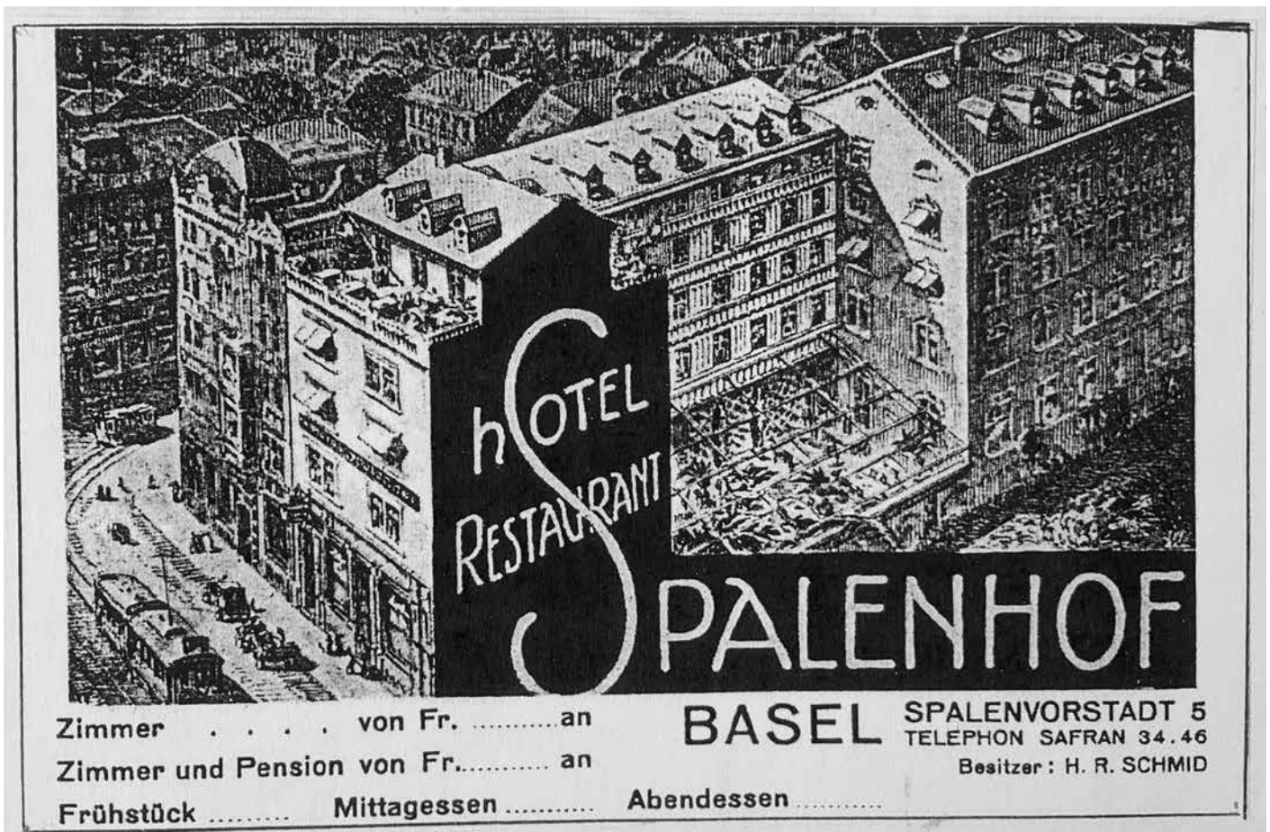
Ansichtskarte um 1917