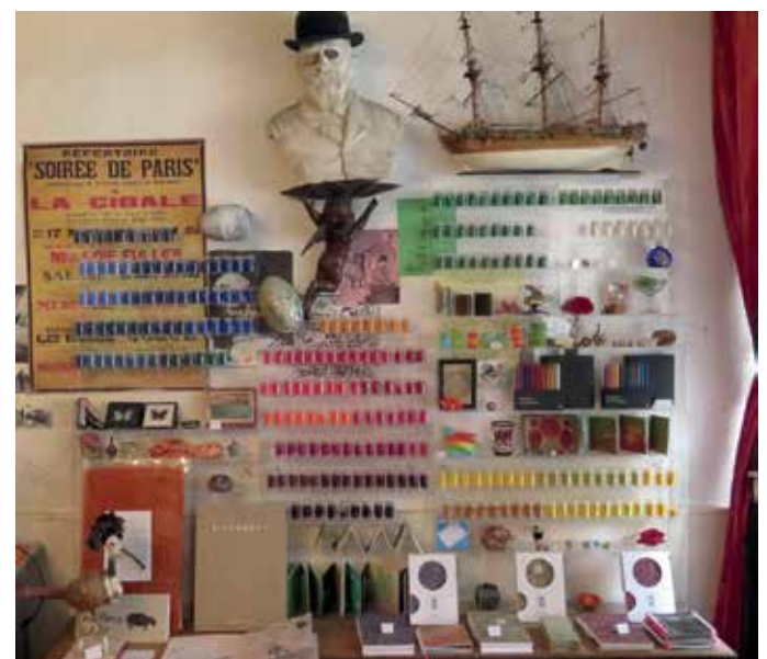
Text und Fotos: Sabine Koitka