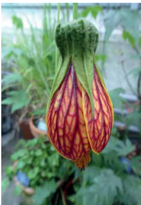
Schönmalve ( Abutilon venosum )

Der Besuch der verschiedenen Abteilungen im grossen Gewächshaus wurde zu einer Offenbarung, was die Artenvielfalt betrifft, die in den Wintermonaten blühen, von den Irisgewächsen bis zum Sauerklee. Manche treiben ganz feine und unscheinbare Blätter und