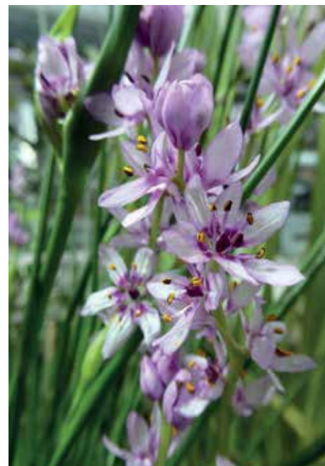
Zarte Blüten in Lila: Onixotis triquetra

Heimat: Brasilien Botanischer Garten / Kalthaus