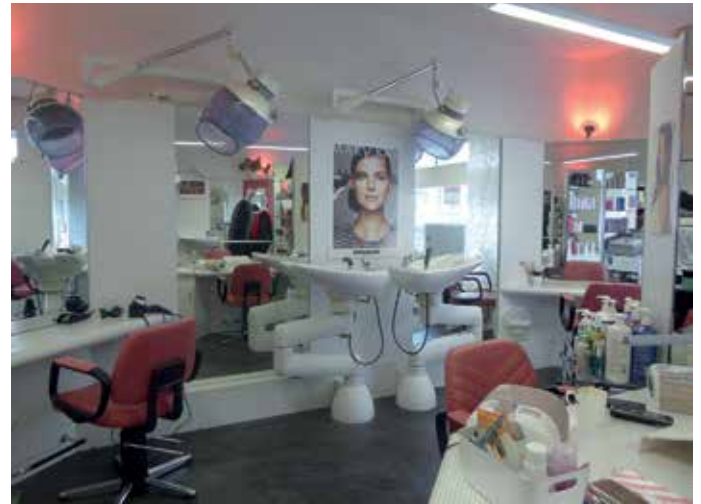
Blick in den Salon

Als wir wegen des Interviews den Salon besuchten, waren von den drei Geschäftsfrauen zwei anwe-