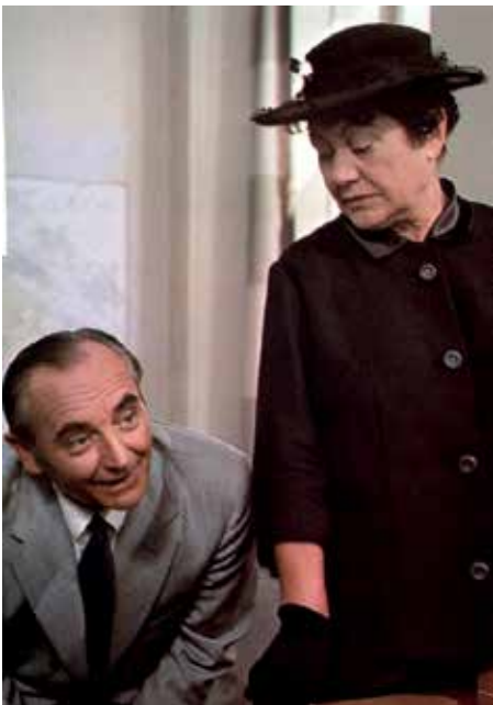
Die Ehrensams vom Spalebärg 77a

So fiktiv wie Sherlock Holmes' Londoner Adresse (Baker Street 221b) ist auch die Wohnung von Guschti und Luise Ehrensams: Einen Spalenberg 77a suchten begeisterte Anhänger der Hörfolgen von Radio Basel schon damals vergebens.